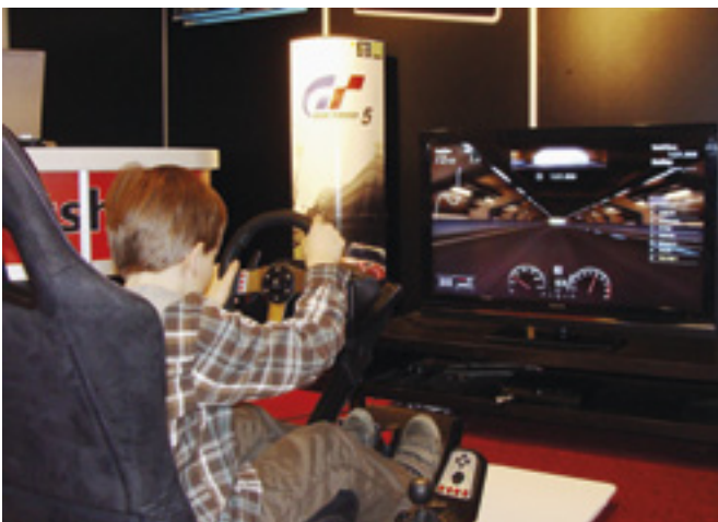
Pleikkarin Gran Turismo-peli oli yksi lasten suosikeista.