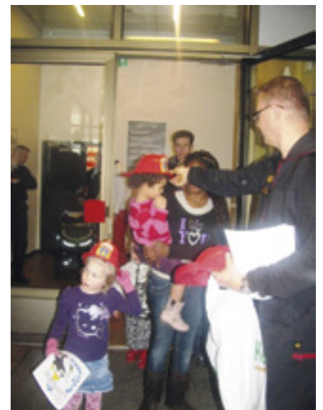
Läksiäislahjaksi saimme mukaan kypärät ja kirjaset