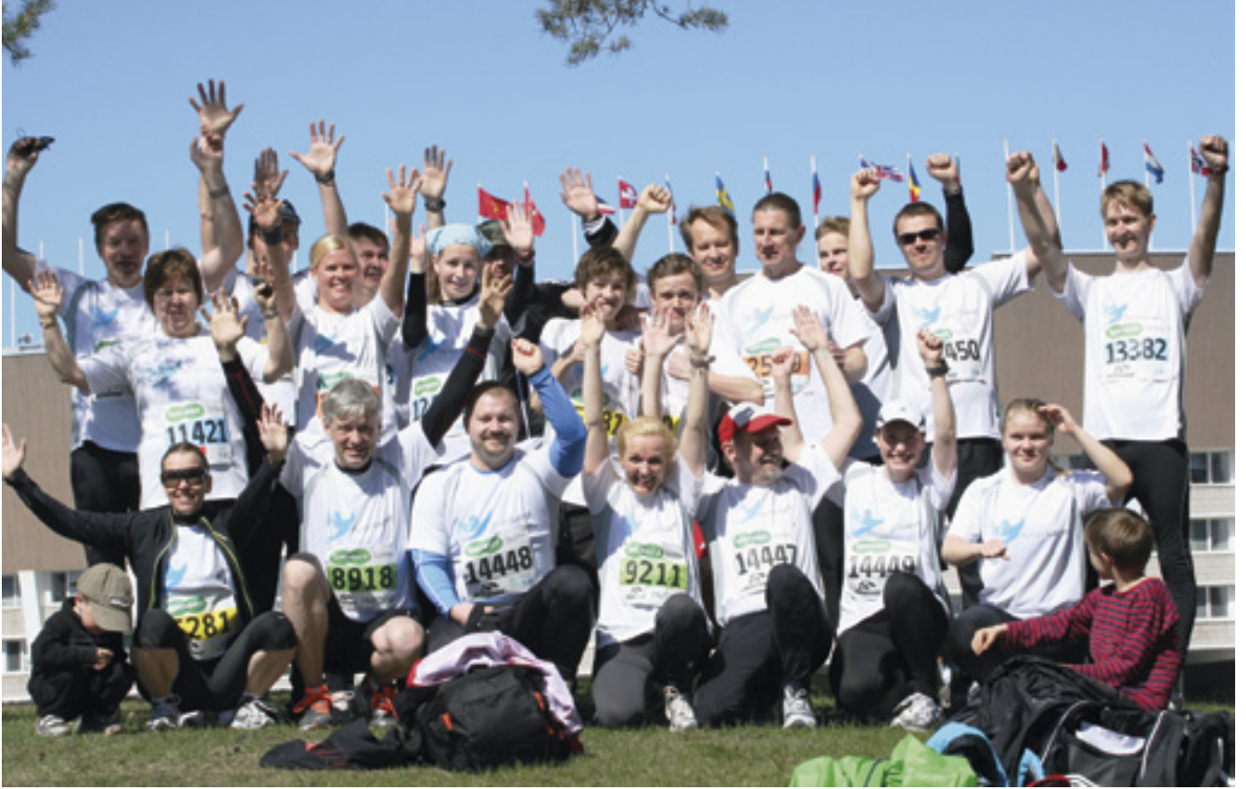
Kympin Lasten iloinen joukkue

Teksti Vesa Ahlstedt