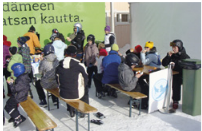
Kymppien lasten laskijoita evästuolla.

Lämmin kiitos kaikille järjestelyissä mukana olleille sekä Lippulaivan K-market Seilorille, joka jälleen tarjosi maukkaita eväitä.