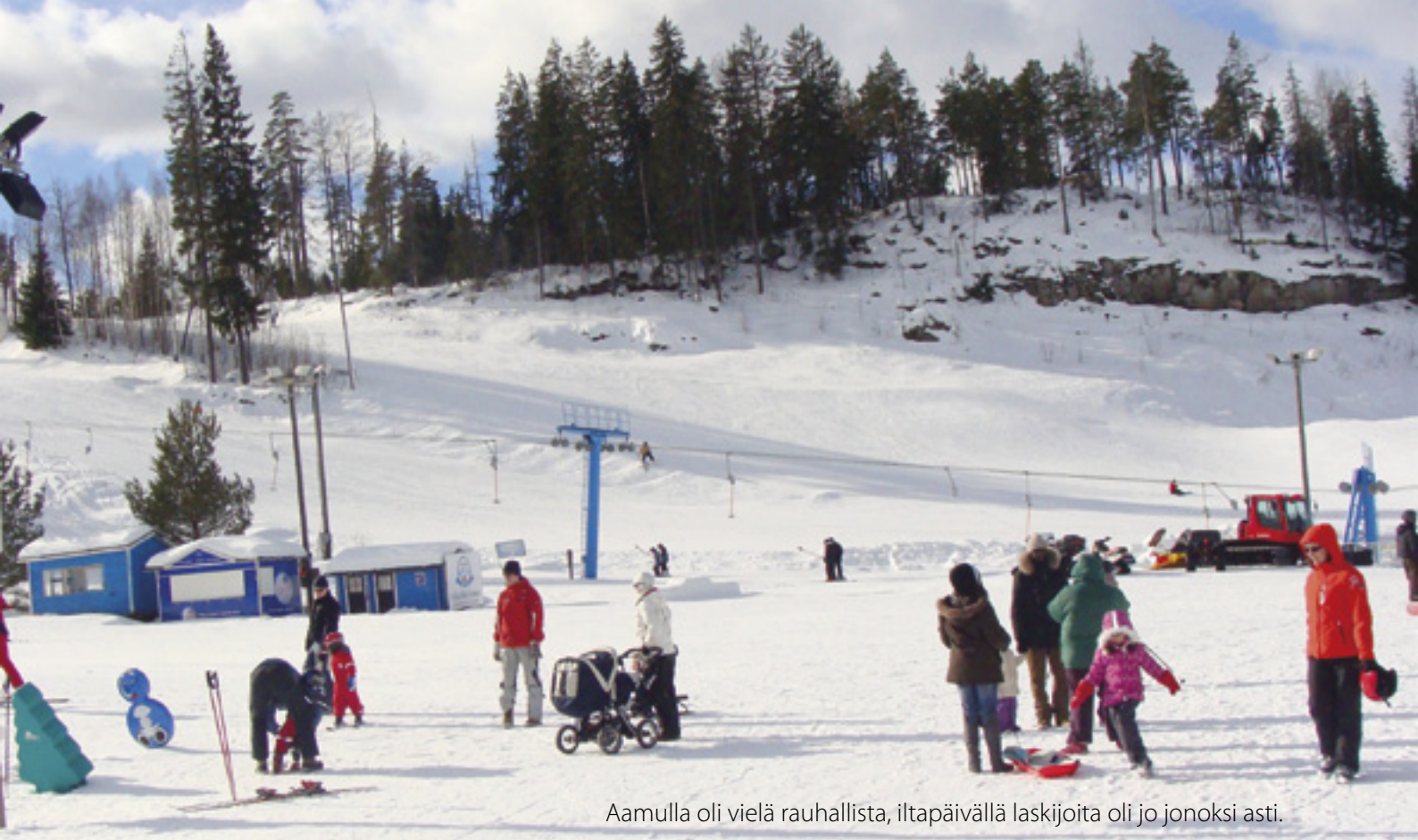
Aamulla oli vielä rauhallista, iltapäivällä laskijoita oli jo jonoksi asti.