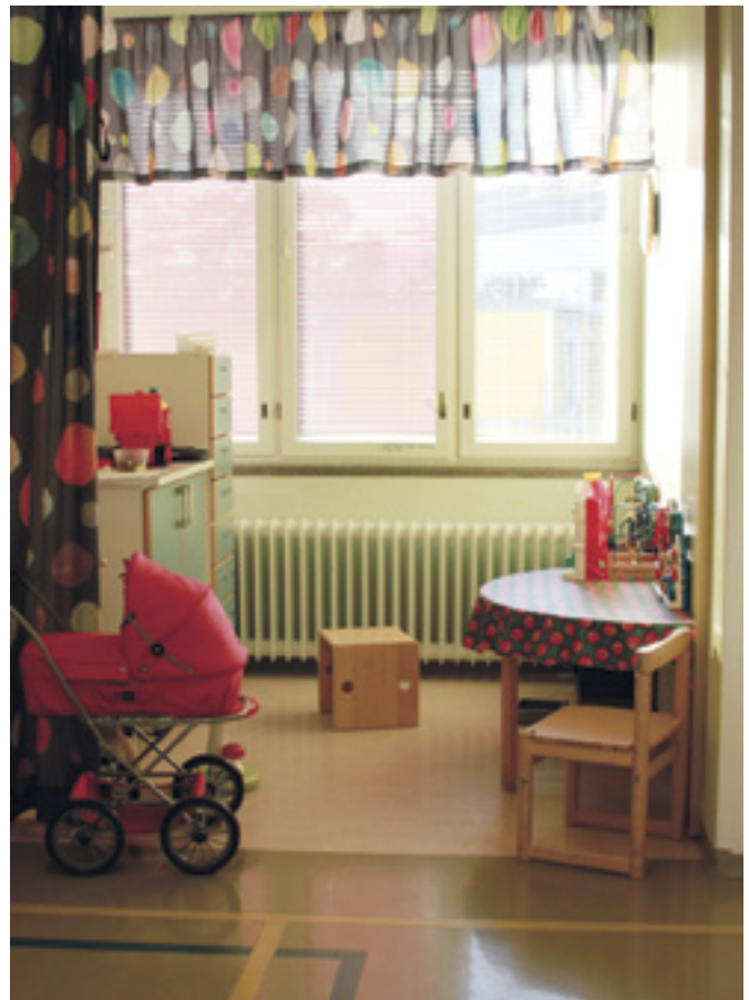
Uudelta osastolta löytyy myös pieni leikkinurkkaus.

kista lääkärivastaanoista, avohoidon hoitopäätöksistä ja tutkimusvastauksista. Uudistuksen jälkeisellä ensimmäisellä tutkimus- tai kontrollikäynnillä vanhempia ohjeistetaan myös uusista puhelinnumeroista. Pysyvämpää lääkärisuhdetta useat vanhemmat ovatkin ehtineet vuosien varrella peräänkuuluttaa.