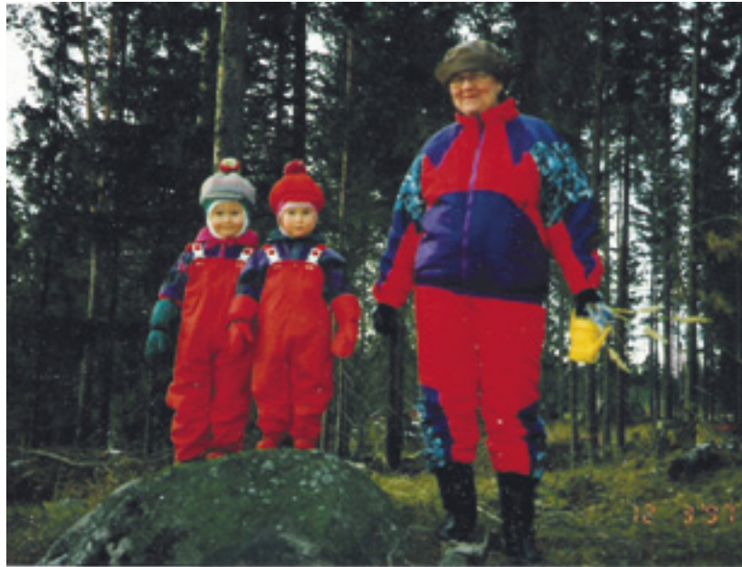
Tytöt löysivät kivitalot.

Aloitin syksyllä 2009 perheleiristä. Toinen leiri oli teemaleiri. Hel-