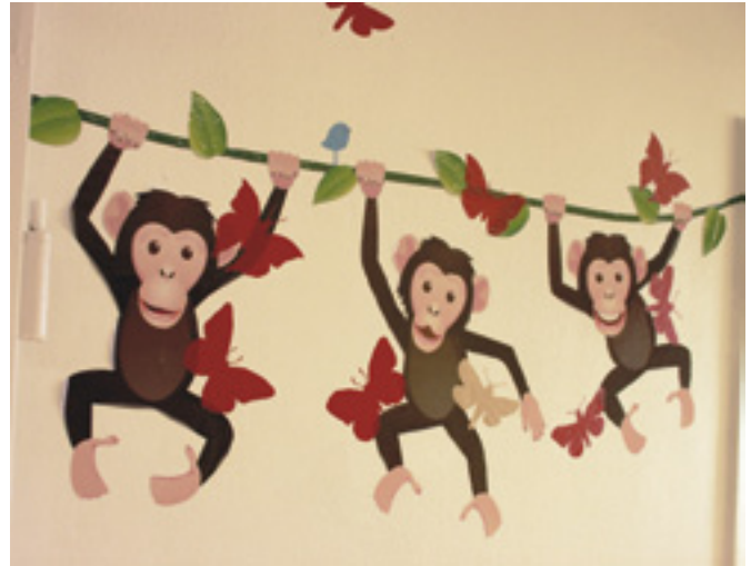
Sisustustuotteita myyvä Zocca Design on koristellut uuden sytostaattiosaston.

Pyrkimyksenä on myös, että lääkäri-hoitaja tiimi ei vaihtuisi käyntien välissä, vaan pysyisi samana. Sama tiimi vastaa myös kai-