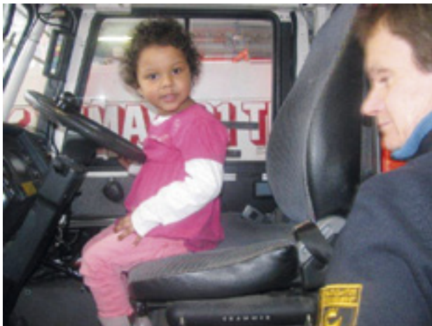
Maya paloauton ohjaimissa

Auditoriossa katsoimme ensiksi viisitoista minuuttia kestävästä esittelystä palolaitoksesta ja sen historiasta. Video oli erittäin mielenkiintoinen ja vangitsi sekä lasten että vanhempien katseet. Videon jälkeen meille esittäytyivät oppaamme: Paloesi-