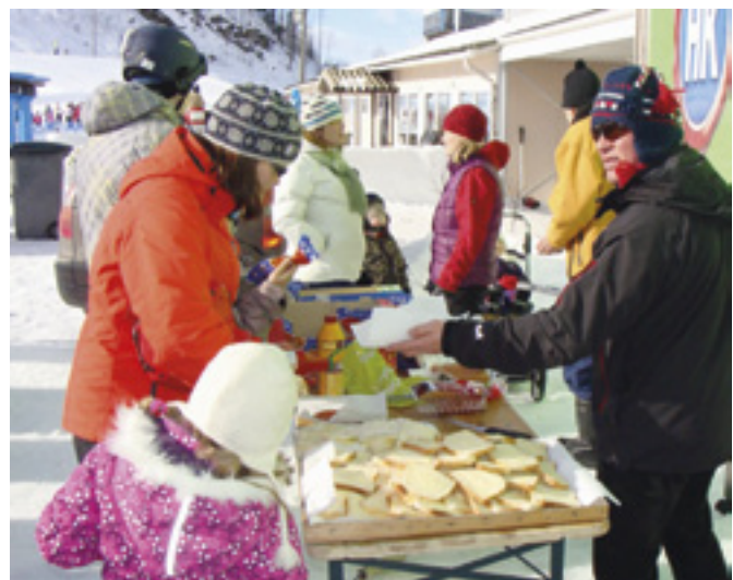
Laskujen välillä yhdistys tarjosi makkaraa, leipiä ja mehua.