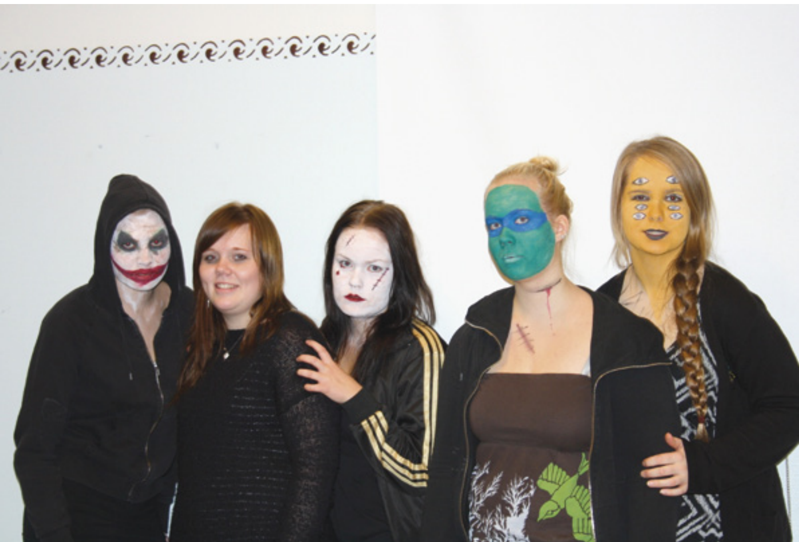
Illalla isokset näyttivät vähän kummilta.

Ruuan jälkeen jäätiin odottelemaan leiribussin saapumista ja siivoamisessa tehtiin viimeisiä silauksia. Kun bussi saapui, kaikki olivat iloisia tulevasta kotiinmenosta, kuitenkin muistaen, että seuraava leiri on jo onneksi pian. Mitähän kivaa joululeirillä tehdään? Kirjoittajat toimivat leirillä isosina.