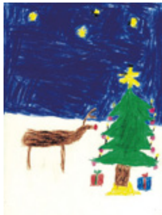
Poro ja kuusi