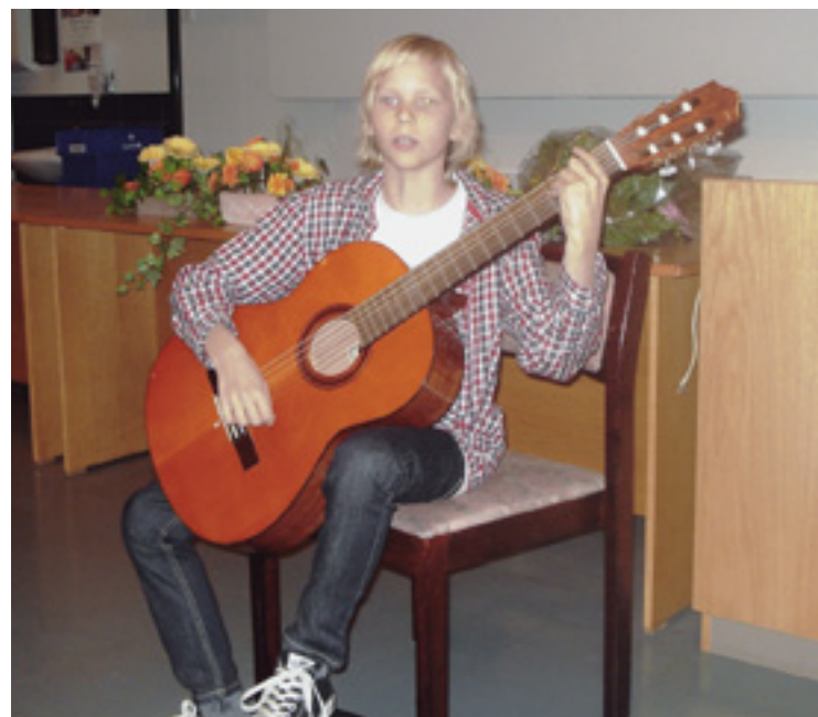
Oula esitti kitaran kanssa kaksi koskettavaa itse tekemäänsä kappaletta.